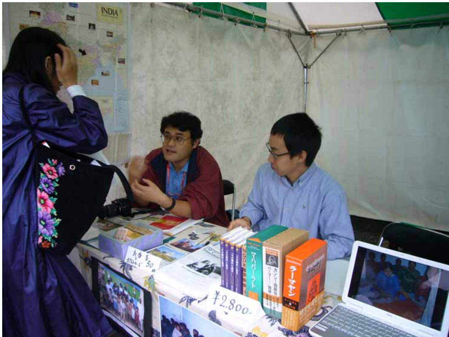
ナマステ・インドア 2007 の出展ブースにて (2007.9.29)

サマンバヤ通信 WEB 配信のお知らせ せ/SEED BANK 始動/インドで話 そう/ナマステ・インドア特 集・イベント参加レポート1/舌 で感じるインド/インドにおける JICA 事業の貧困対策について/ 2007 年下期送金を完了しました