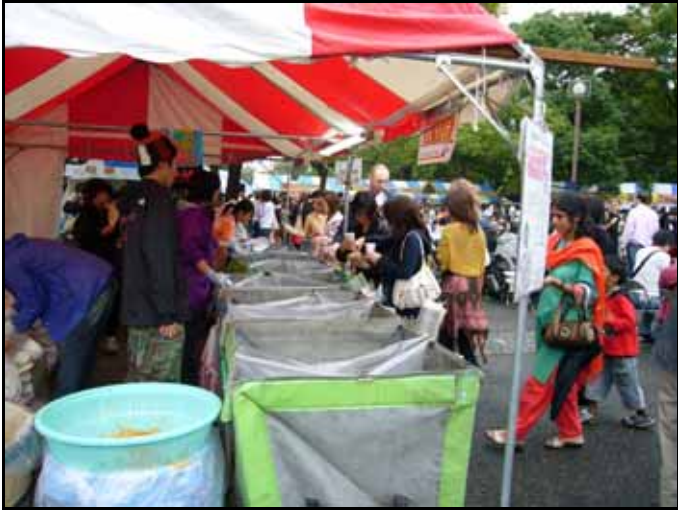
細かく分別されるゴミ捨て場

NPO,NGO の団体は意外に少なく、メインはレストラン、民芸品、衣料などの販売のような印象を受けた。ほかの NGO ブースをまわり、資料を配っていたのが、多くの人がインドに行き魅せられて同じような思いをもっているということだった。