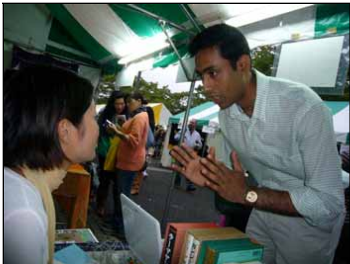
サマンバヤの会のブースを訪れるインド人。 日本語がとても上手だった。

もっと多くの人にインドの文化の良さを伝え、まずはインドを好きになってもらう、そこから国際協力でも国際交流も深まるのではないかと思った。