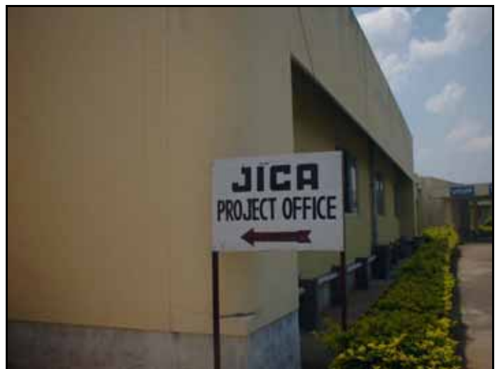
JICA 事務所を示す看板

同じ医療系でリプロダクティブ・ヘルス (RCH) 支援プログラムというも行っています。RCH というのは母子保健という意味で、インドでは出生率が高く、しかも、幼児の死亡率も高いため、母子の健康に不安な面が多々あります。技術協力プロジェクトの「リプロダクティブ・ヘルス向上及び女性のエンパワーメント支援」というプロジェクトでは、