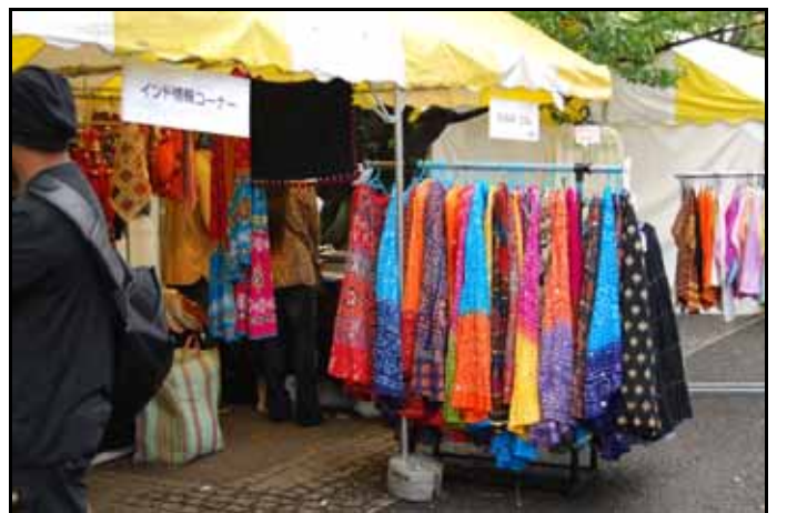
サリーを販売しているブース。 日本人だけでなく多くのインド人が訪れていた。

私がインドに行ったのは約 2 年前、驚かされたのは街の汚さである。インド人はそこらへんにゴミをポイポイ捨てる。しかし、今回のフェスティバルではそのようなこともなく、きちんとゴミが分別してすてられていた。